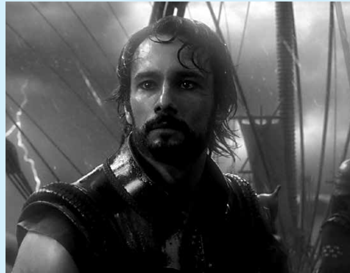
Rodrigo Santoro é uma das estrelas do filme