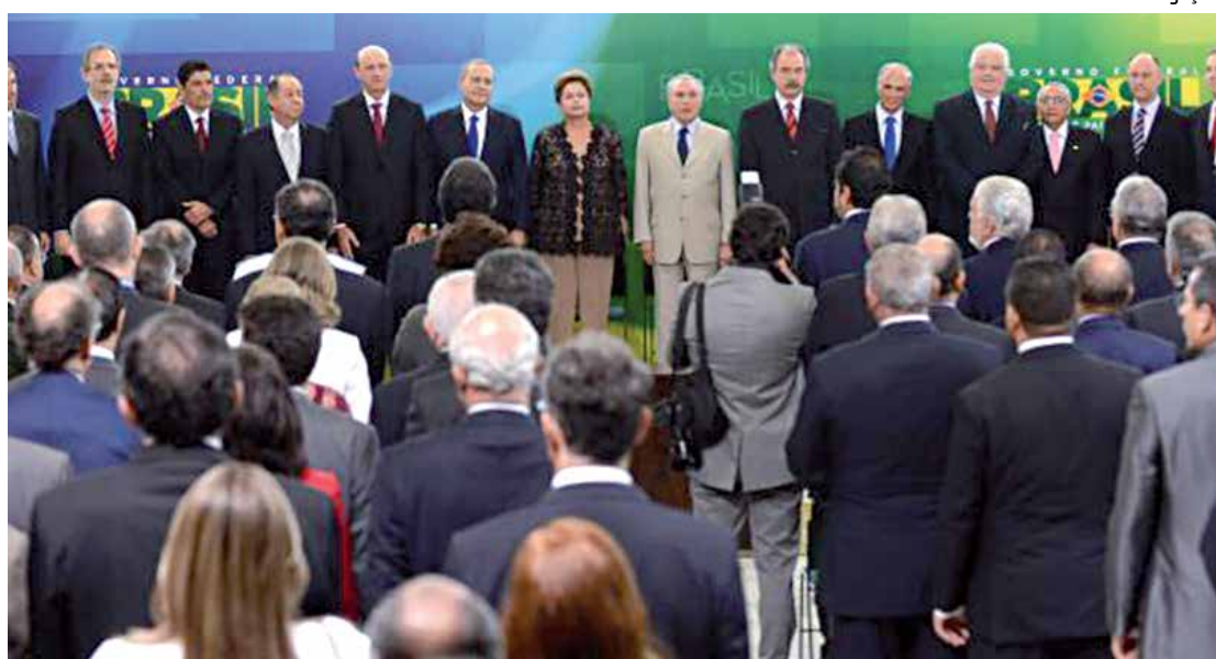
Presidente Dilma Rousseff posa para a foto oficial na cerimônia de posse de seis novos ministros

Há pouco mais de um mês, Dilma já havia feito troca de comando nos ministérios da Educação, da Saúde, da Secretaria de Comunicação, e da Casa Civil.