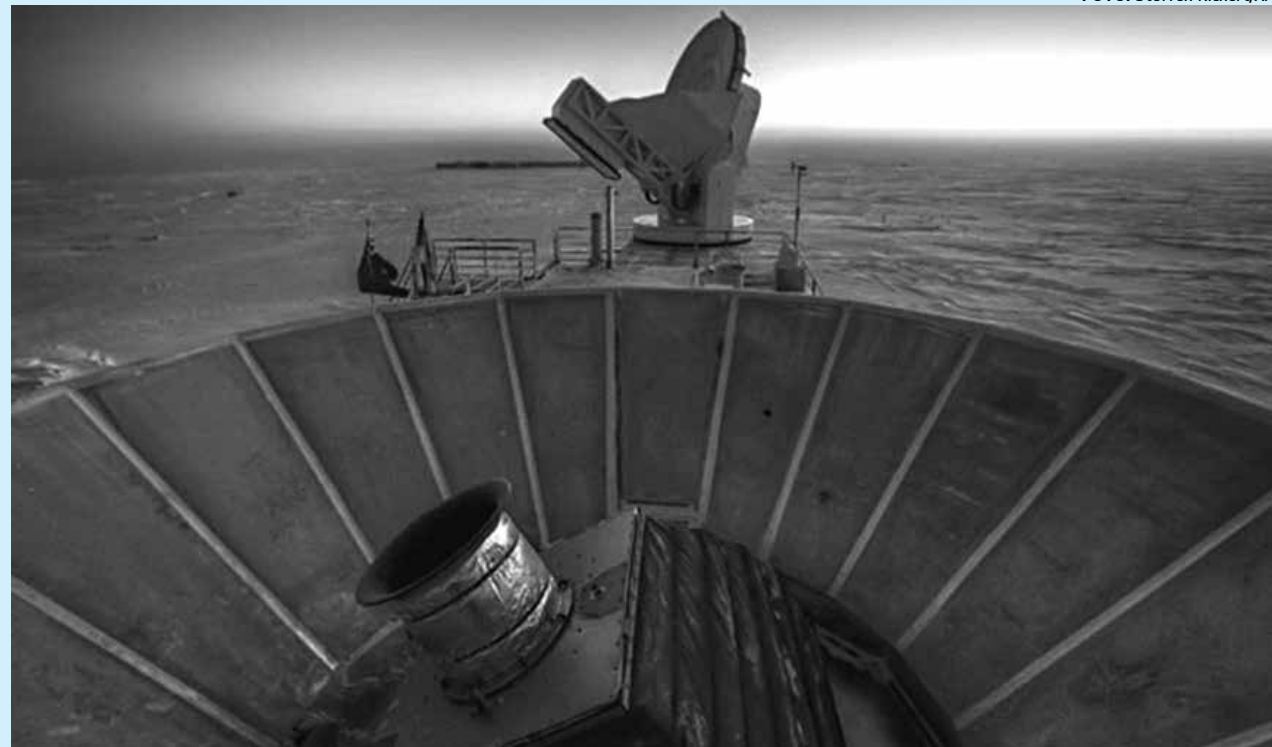
Telescópio no Polo Sul registrou existência de ondulações de espaço-tempo que aponta para expansão rápida do universo