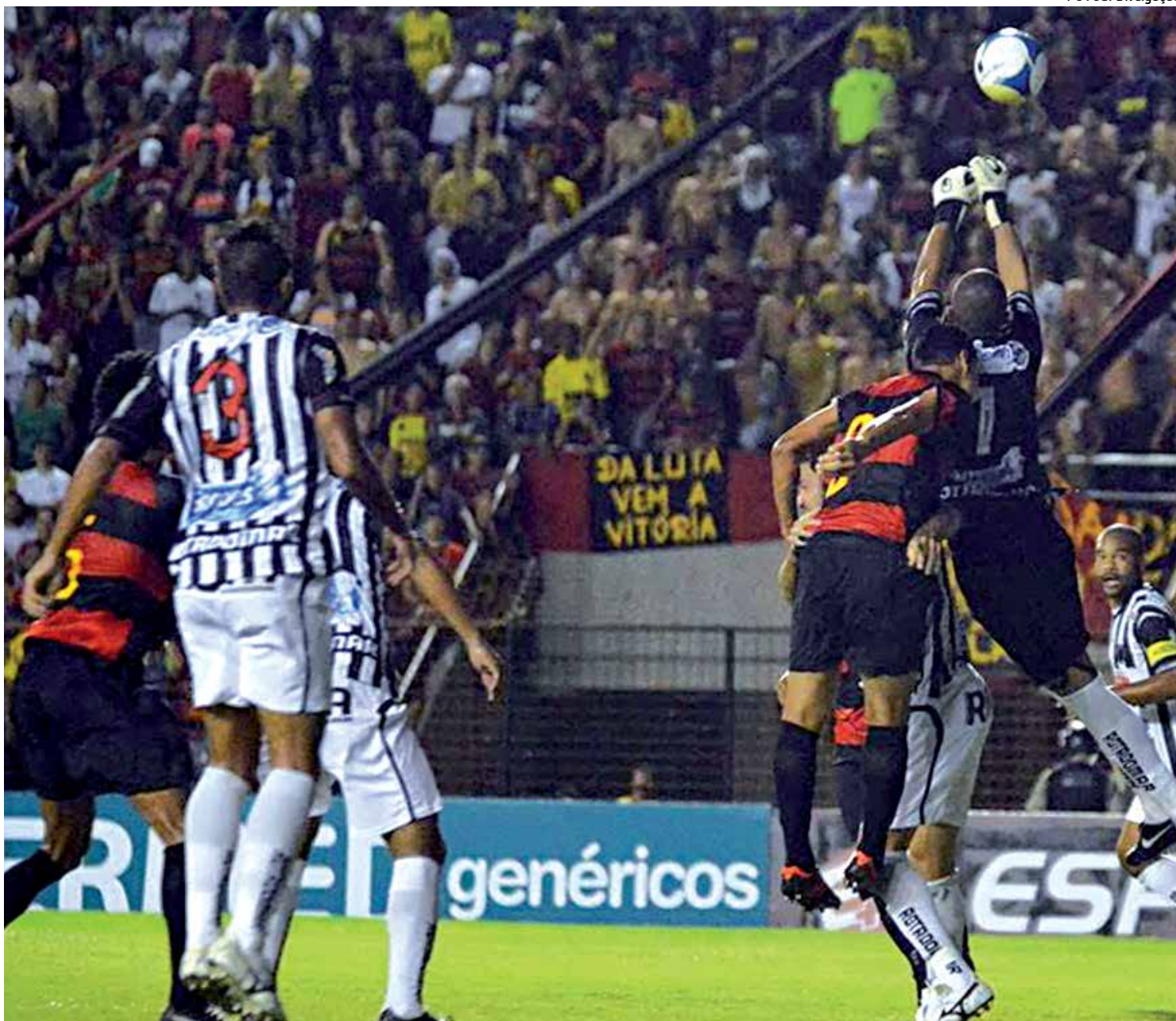
A última partida oficial do Botafogo foi contra o Sport Recife ainda pela Copa do Nordeste no dia 6 de fevereiro quando foi eliminado

Segundo o regulamento do Campeonato Paraibano de 2014, CSP e Auto Esporte vão disputar o cruzamento olímpico final com vantagens. Aquele que tiver mais pontos, somando-se os dois turnos, enfrentará o quarto classificado, enquanto que o segundo vai enfrentar o