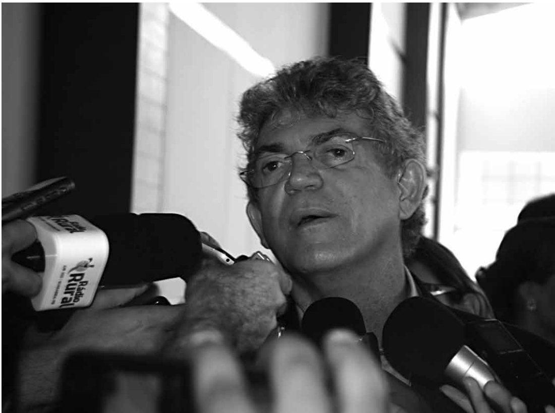
O governador Ricardo Coutinho durante entrevista coletiva, ontem, no Centro de Convenções em JP

“De minha parte o procurador pode ficar tranquilo. A Rádio Tabajara tem uma programação diversificada, onde tanto pessoas do Governo como da oposição tem acesso aos seus microfones. Essa é e