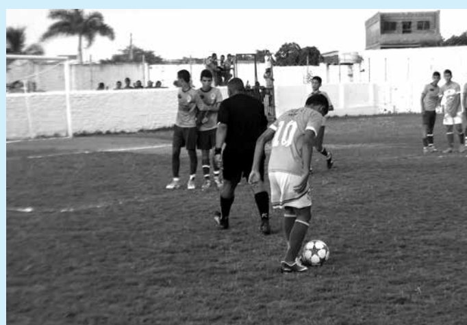
A Seleção de Monteiro fez bonito na grande final da Copa Paraíba e ganhou do Nacional por 3 a 1 em jogo disputado no Feitosão