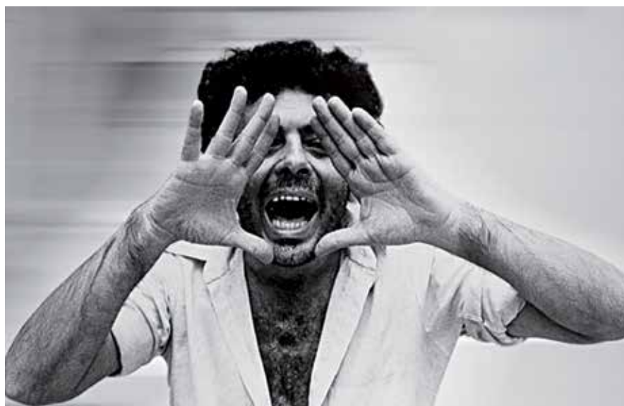
O cineasta Glauber Rocha, considerado um dos melhores da América Latina retratado em diferentes fases da sua vida. O autor de Barravento (1962) também era cineclubista