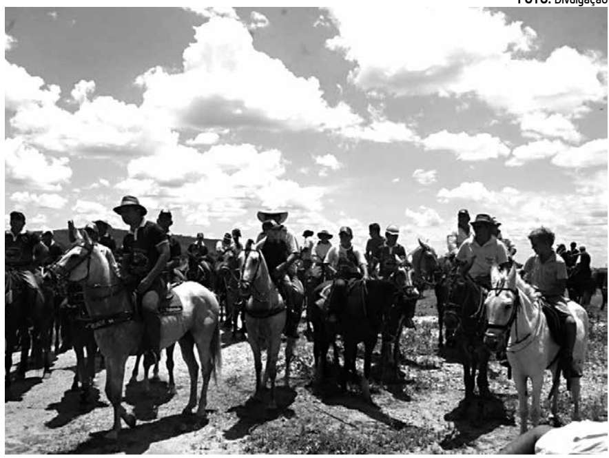
Cavalgada foi um dos pontos altos das comemorações ao Dia de São José