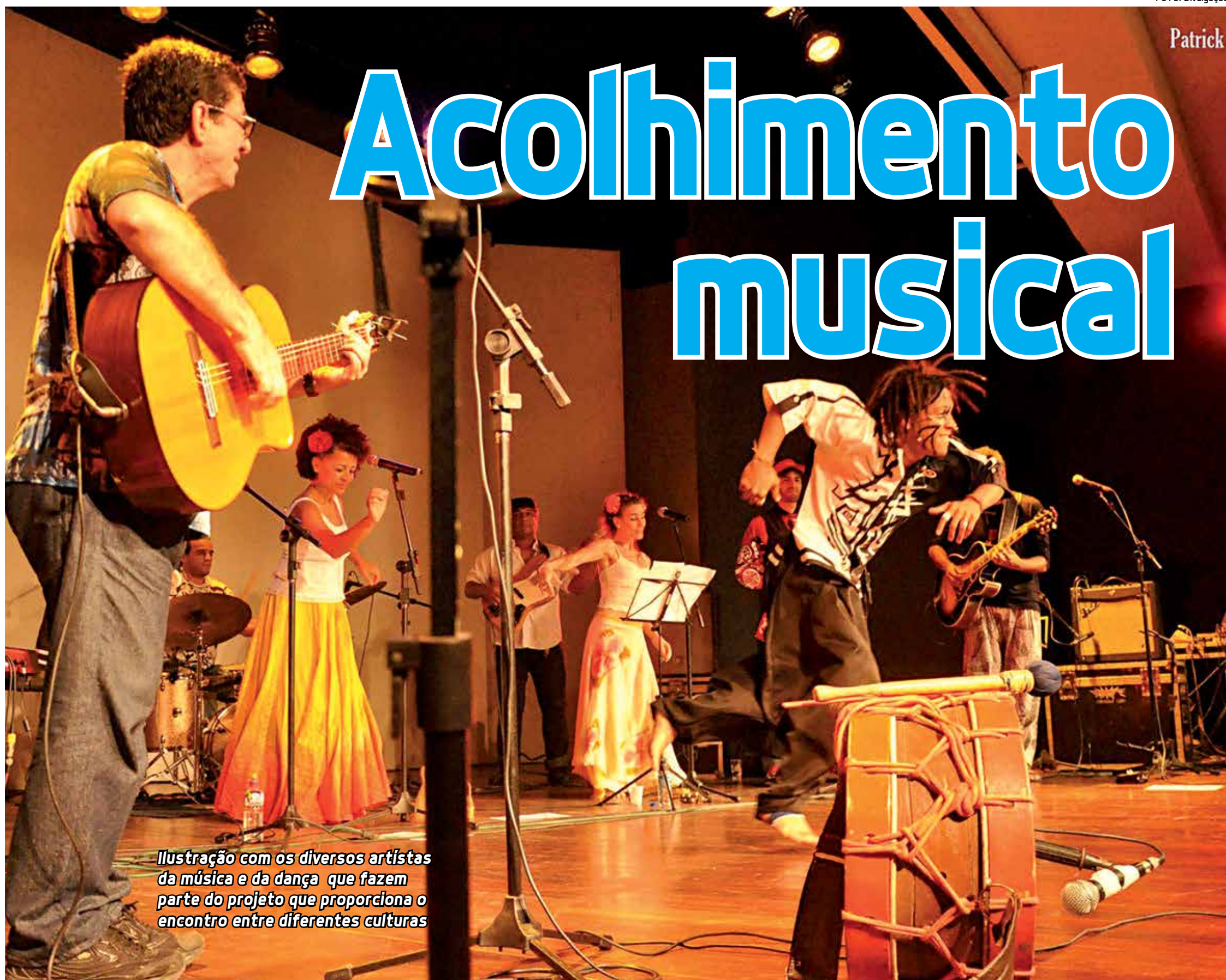
Ilustração com os diversos artistas da música e da dança que fazem parte do projeto que proporciona o encontro entre diferentes culturas